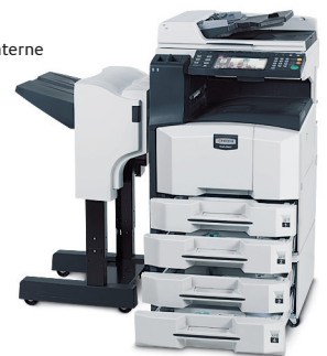
Bac papier (PF-670)

Le produit représenté comprend des options